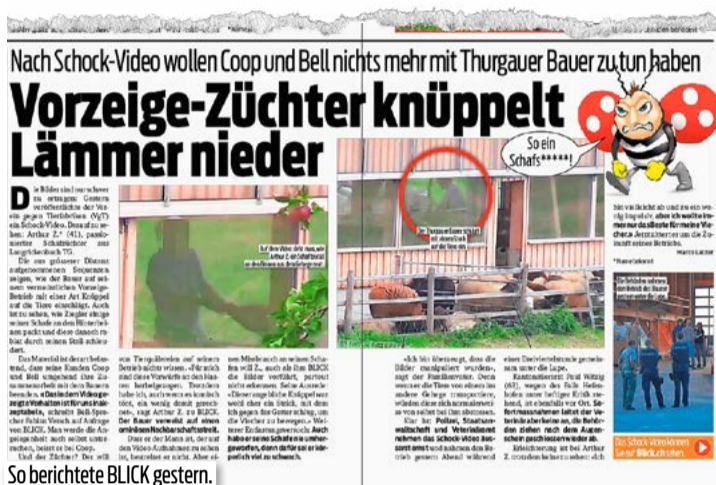
So berichtete BLICK gestern.

Nicht zuletzt leidet auch die Qualität des Fleisches. Durch den Stress wird im Körper Adrenalin ausgeschüttet und das merkt man dem Fleisch an. Es gibt nur ganz wenige Fleischlieferanten, die ihre Tiere auf dem Feld erschiessen, von einem Hochsitz aus, während sie am Fressen sind. Dadurch leiden die Tiere nicht und die Qualität des Fleisches ist besser. Das ist aber mit Kos-