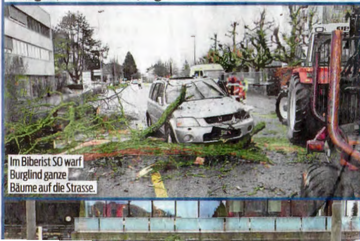
Im Biberist SO warf Burglind ganze Bäume auf die Strasse.

Hausdächer weg. Es gab mehrere Verletzte – doch zum Glück passierte nichts Schlimmeres. Alle Fakten von A-Z. → Seiten 4-5