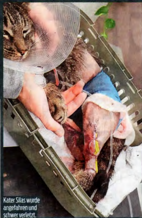
Kater Silas wurde angefahren und schwer verletzt.

Für Experten der Stiftung für das Tier im Recht (TIR) ist klar: Mit Partei- und Beschwerderechte könnten solche Fälle viel vehementer verfolgt werden.