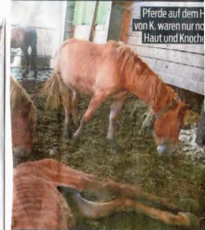
Pferde auf dem Hof von K. waren nur noch Haut und Knochen.

Marco Latzer (Text)