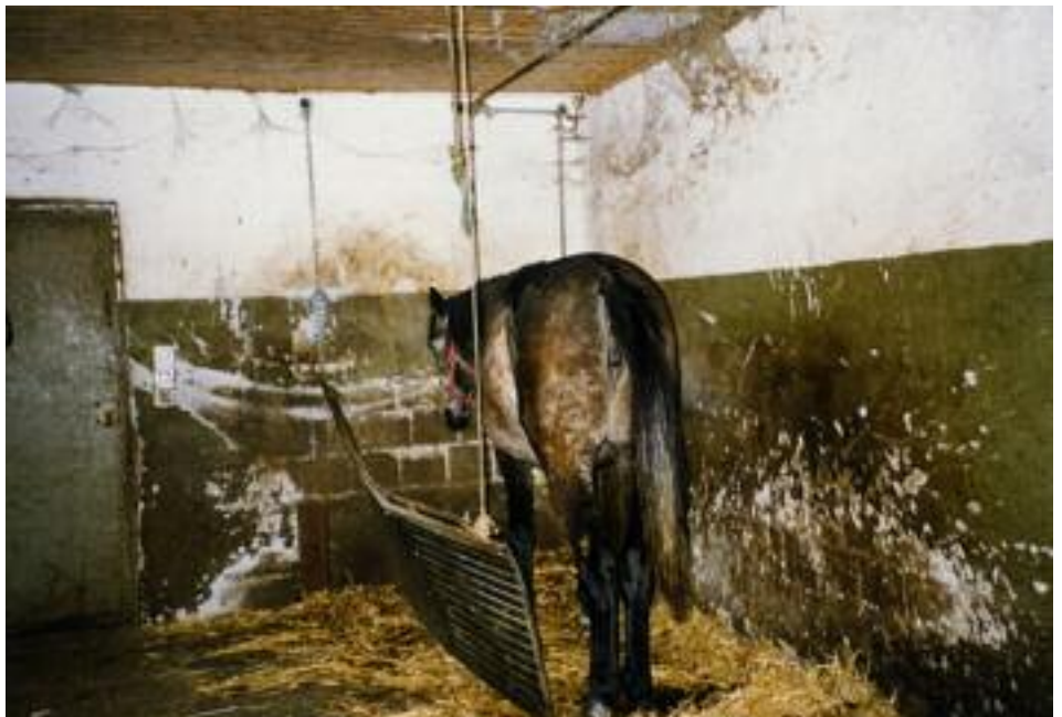
▼ Stall Kesselring in Polen: 30 Pferde in Anbindehaltung.