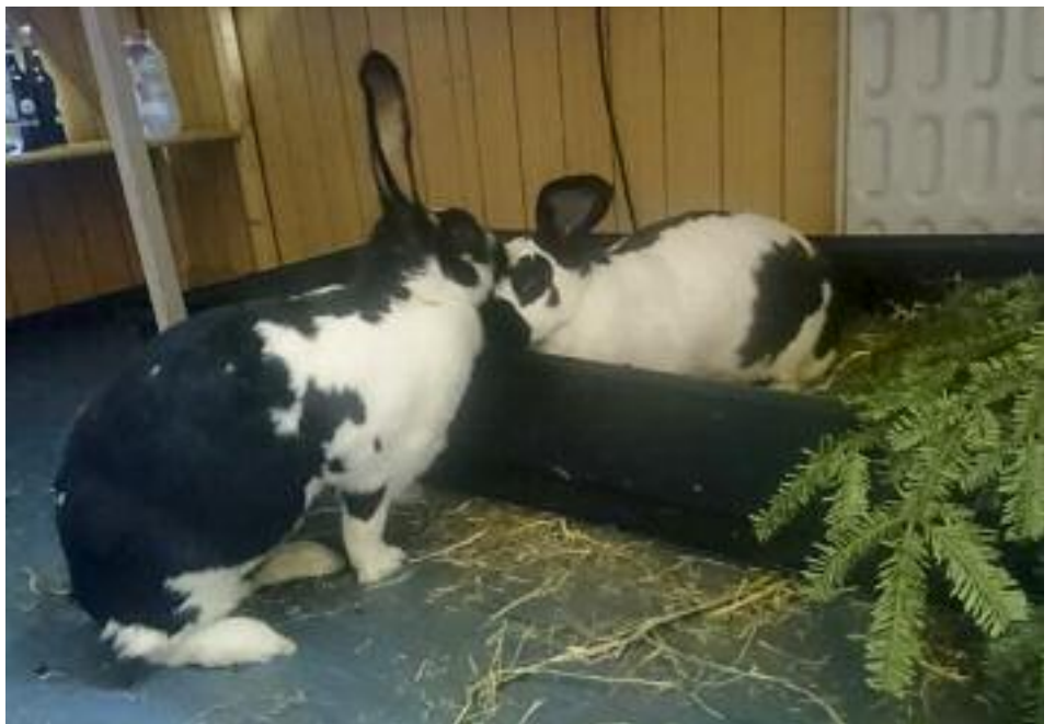
Das erste Beschnupern....

Wir hatten unser Futterhäuschen bereits liebevoll für die beiden vorbereitet. Bei Kaninchen, welche so lange in einem Kastenstall leben, achten wir jeweils darauf, ihnen anfangs noch nicht zu viel Platz zu geben. Denn in ihrer Begeisterung, endlich einmal herumhoppeln zu können, ziehen sich die Tiere schnell Zerrungen zu, da die Muskeln durch den chronischen Bewegungsmangel oftmals richtiggehend degene-