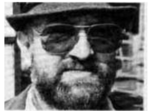
▲ U.K., Hefenhofen

Nach der Übernahme des Hofes durch Sohn U.K. wurde alles noch schlimmer und immer schlimmer - bis zur grossen, finalen Tiertragödie im Jahr 2017.