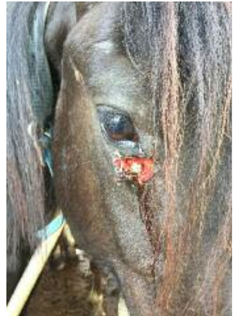
▲ Verletztes Pferd, ohne Pflege und veterinärmedizinische Behandlung.