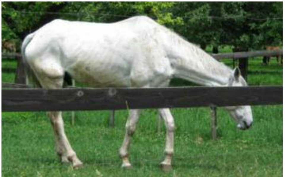
▲ Schon 2008: Abgemagertes Pferd auf dem Hof Kesselring.

Die zwei Freiburgerstuten, welche mir vorgehritten wurden, versuchten ihre Reiterinnen runter zu bu-