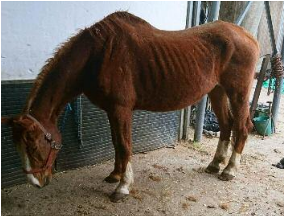
Hungernde Pferde bei U.K. - Er fütterte nur verschimmeltes altes Brot.