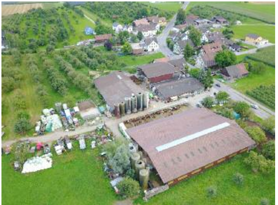
▲Der Hof Kesselring in Hefenhofen (Pferdezucht und -Handel, Kühe, Schweine).

Vor dem Untersuchungsrichter sagte U.K. später zu diesem Zutode-Quälen dieses Pferdes: "Geschicht dem Kerli recht. Der Kerli musste drankommen. Fertig." - weil das Pferd bei der Misshandlung nicht brav alles still erduldet, sondern sich in Panik wehrte. Später an der Gerichtsverhandlung meinte er dann auf die Frage des Gerichtspräsidenten, ob er wieder so vorgehen würde: "Ich würde nicht mehr lan-