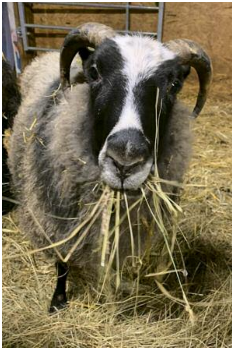
▲ Heute kann ich allen Tieren mit einem guten Gewissen in die Augen schauen, wie hier meinem lieben Patenschäfchen "Wischnu", welches auf dem Lebenshof Tante Martha ein Leben in Sicherheit führt. www.tante-martha.ch

Wenn auch Ihnen Ihre Gesundheit wichtig ist, wenn Sie Tiere lieben und unserer Umwelt Sorge tragen wollen und wenn Sie erleben möchten, wie etwas, was zuerst wie ein Verzicht wirkt, zu einer grossen Bereicherung werden kann, dann ist eine vegane Lebensweise auch etwas für Sie! Probieren Sie es doch einfach mal aus. Es ist so viel einfacher, als dass es am Anfang aussieht, und der persönliche Gewinn, der daraus hervor geht, wird Sie begeistern. Ich freue mich, wenn Sie mir Ihre Erfahrungsberichte schreiben.