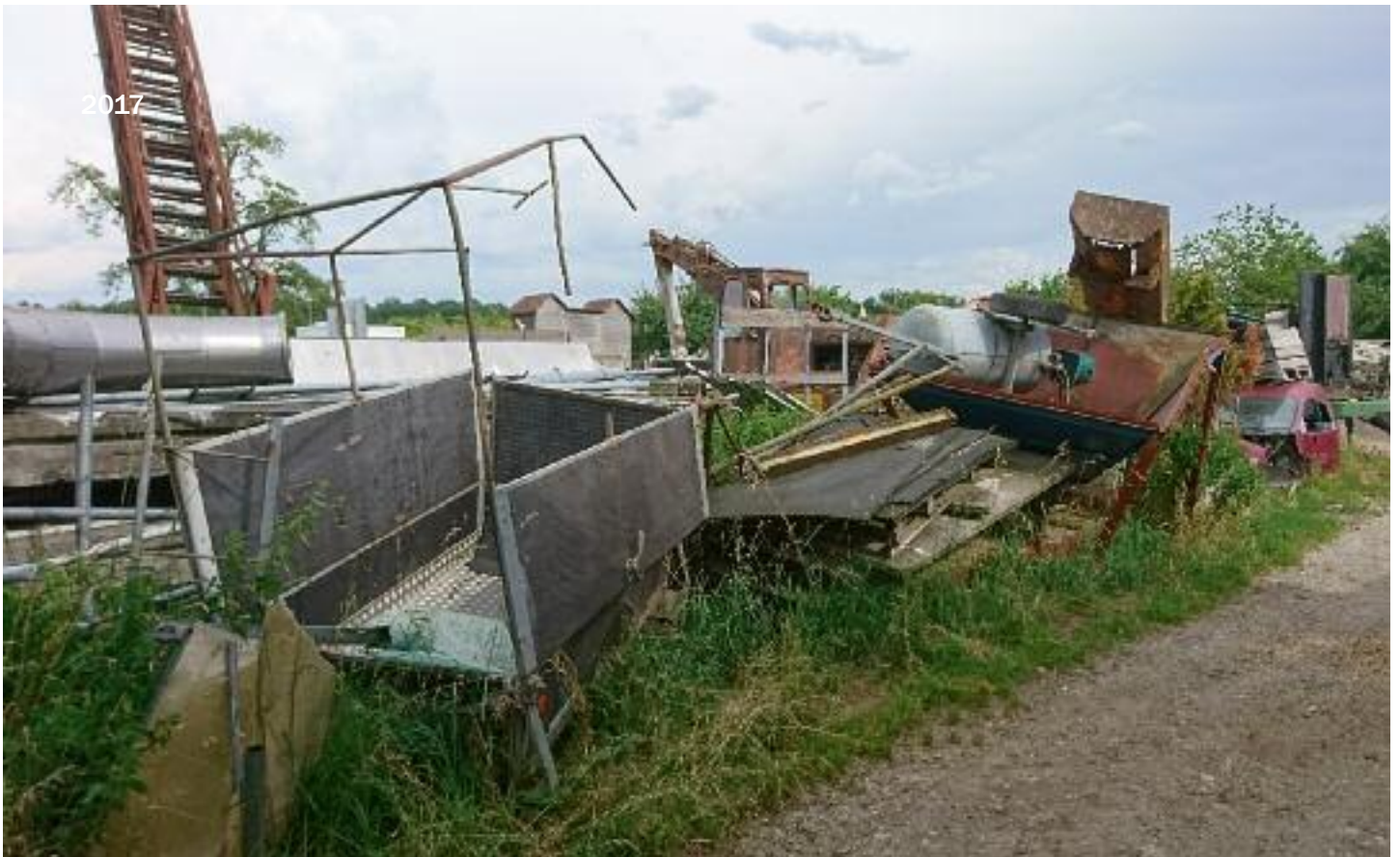
▲ Die Unordnung auf dem Hof Kesselring wäre Privatsache, wenn sie nicht Ausdruck einer Verwahrlosung wäre, welche auch die Tiere trifft.

here Auflagen des Amtes für Umwelt nicht befolgt hatte. Nachdem sich der Beamte vorgestellt hatte, wurde er von Kesselring sogleich zusammengeschlagen. Der Arboner Vizestatthalter Brunner erliess mit fadenscheinigster Begründung eine Einstellungsverfügung betreffend Gewalt und Drohung gegen Beamte (dieser sei nicht als Beamte erkennbar gewesen) und erliess lediglich eine Trinkgeldbusse wegen einfacher Tätlichkeit - eine behördliche Ermunterung an U.K., weiterhin gewalttätig gegen Mensch und Tier vorzugehen, was Kesselring denn auch fleissig tat. Die Machenschaften dieses Beamten gingen all die Jahre ebenso ungehindert weiter wie diejenigen von Kantonstierarzt Witzig.