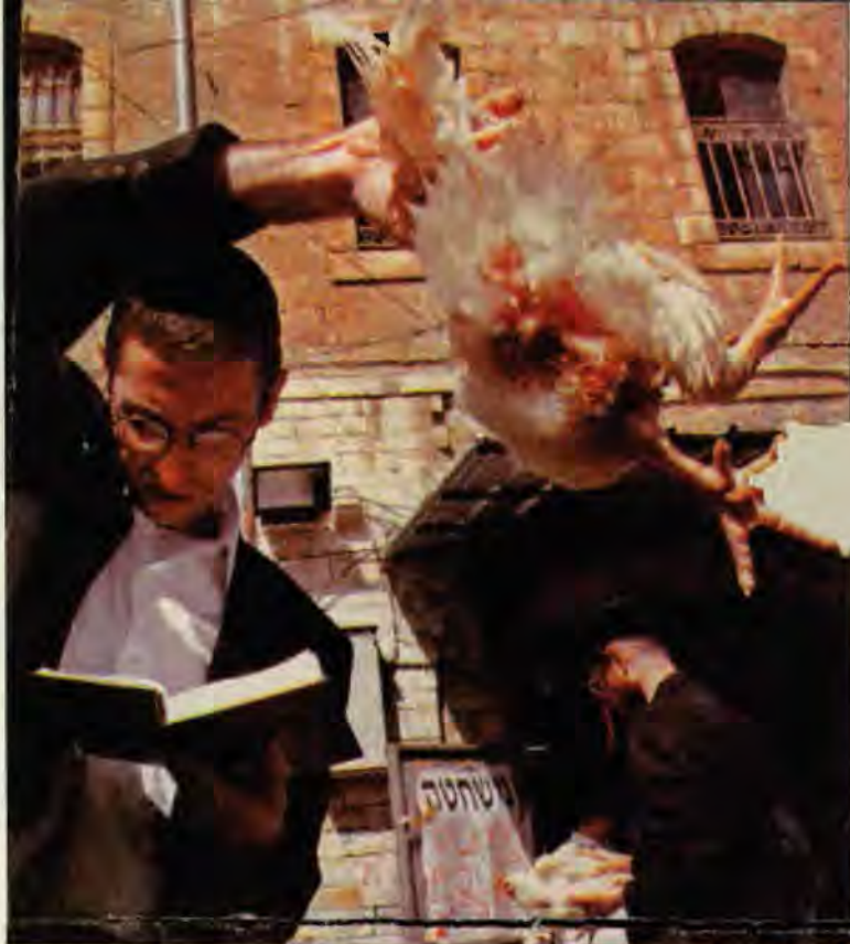
Jom-Kippur-Ritual zur Sündenbefreiung.

Erlaubnis zur Folterung eines Häftlings in Israel. Das Oberste Gericht Israels hat am Sonntag mit fünf gegen vier Stimmen entschieden, dass der Geheimdienst beim Verhör des mutmasslichen Terroristenführers Abdel Rahmans Ranimat physischen Druck anwenden darf. ... Bezeichnend ist, dass das Urteil nicht bloss von gemässigtem Druck spricht, der zum Beispiel Schlafentzug, Fesselung mit Hand- und Fusschellen, heftiges Schütteln oder die Stülpung eines Sackes über den Kopf umfasst, da solches dem Geheimdienst ja sowieso gestattet ist...."