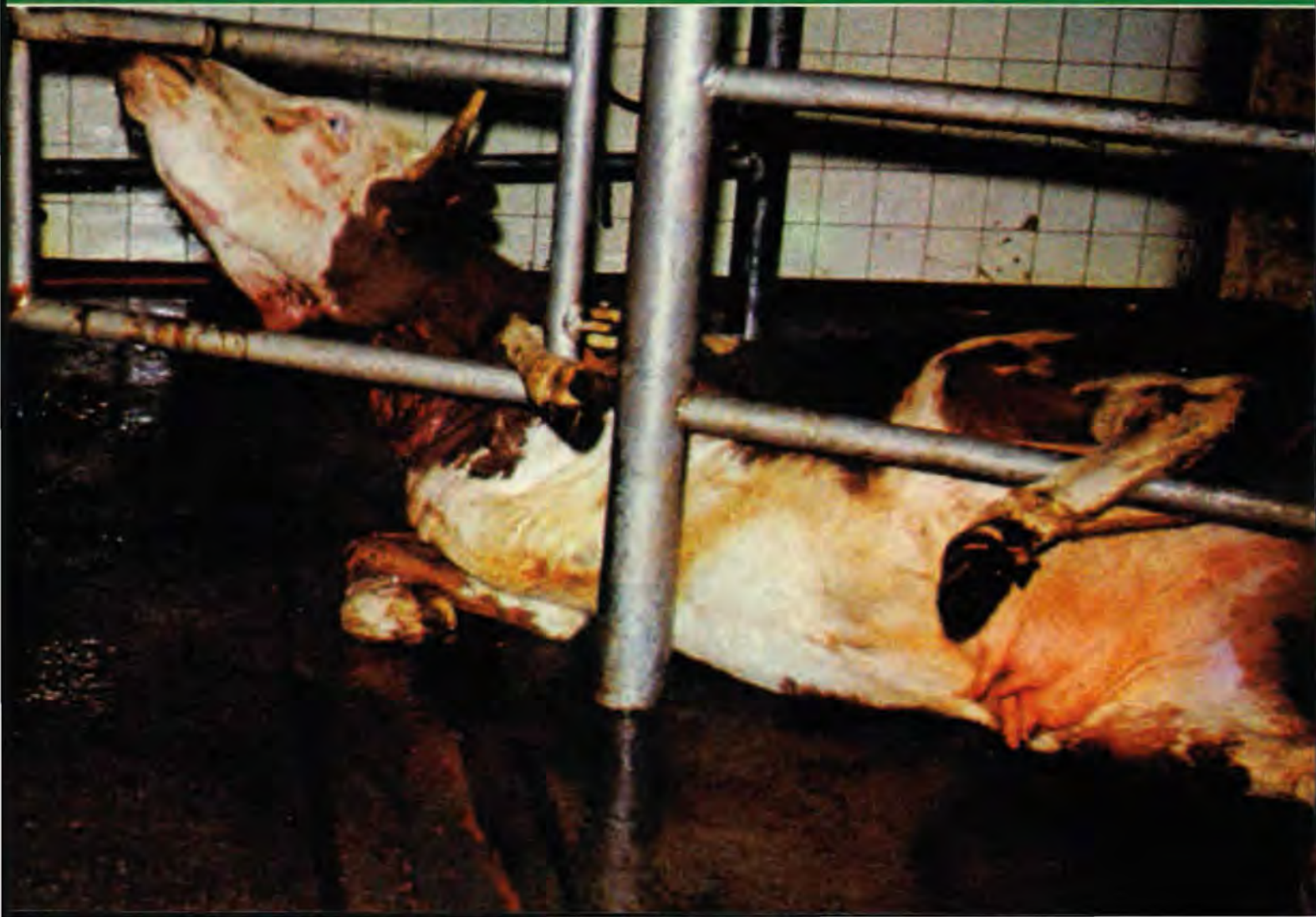
Abbildung unten: Diese Aufnahme aus einem jüdischen Schlachthof in Frankreich, von wo Schächtfleisch in die Schweiz importiert wird, zeigt die Bestialität dieser Ritualmorde deutlich: Beachten Sie, wie diese Kuh nach dem Durchschneiden des Halses durch Kehlkopf, Luft- und Speiseröhre bei vollem Bewusstsein unter unsäglichem Schmerz ihren Kopf zum Himmel streckt.

Erwin Kessler, Gründer und Präsident des Vereins gegen Tierfabriken Schweiz VgT