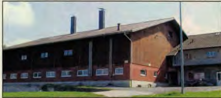
Schweinefabrik der Milchgenossenschaft Tuttwil

Solche Manipulationen zur Verschleierung der grauenhaften Zustände in der Schweizer Landwirtschaft sind üblich. Behörden und regimetreue Medien arbeiten dabei eng zusammen, unterstützt von parteiabhängigen Richtern, welche mit Willkürjustiz versuchen, den VgT mundtot zu machen, denn die Schweizer Öffentlichkeit erfährt nur aus den VgT-Nachrichten wie grauenhaft die Zustände wirklich sind.