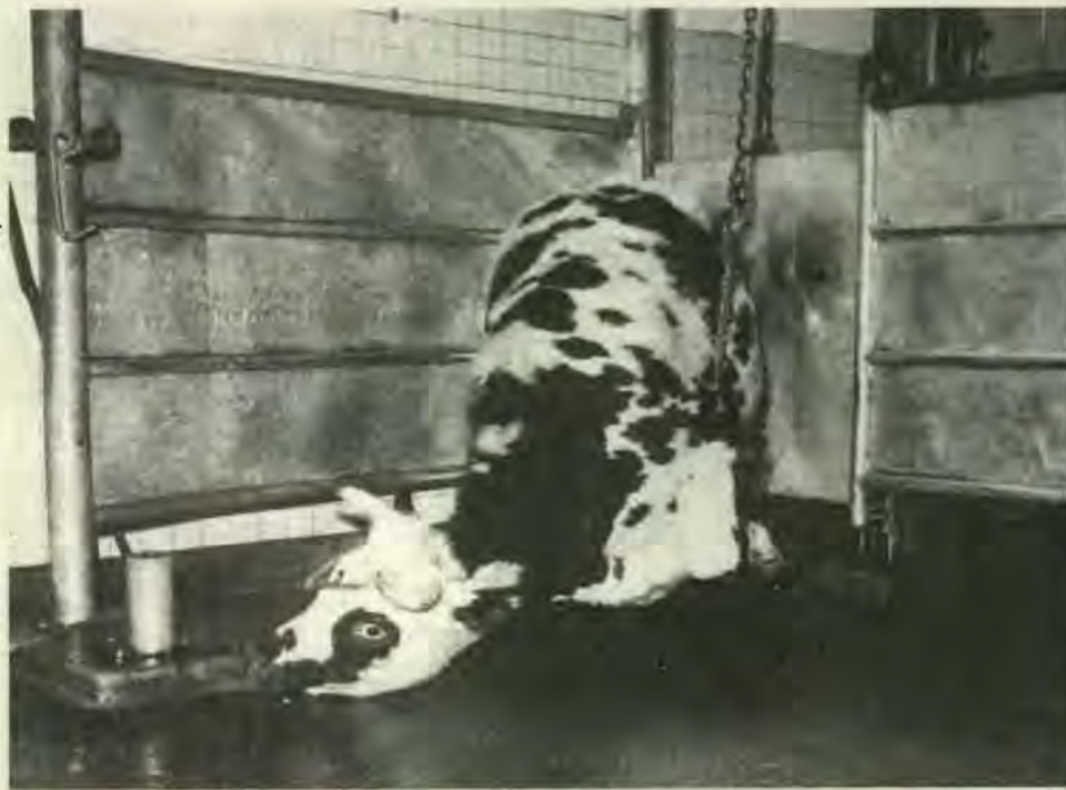
Die Augen in Todesangst weit aufgerissen