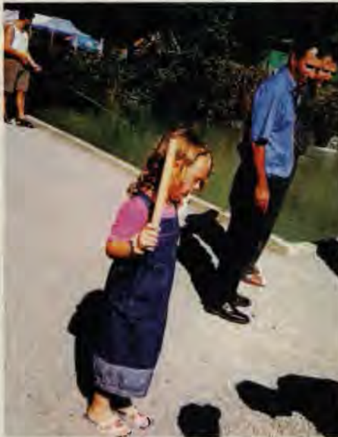
Bereitschaftsstellung zu Mord und Totschlag - Kindererziehung nach Lochmüli-Art. Die Forelle zappelt auf dem scharfkantigen Kies, da die Plausch-Fischer nicht wissen, wie sie den Fisch fassen und töten sollen.

würgen des Angels aus dem Mund, die Fische zucken noch, sind noch immer nicht tot. Eine noble Gattin sagt zu ihrem Mann, der mit einem Sackmesser im Rachen des Fisches herumstochert (siehe Abbildung): "Du, ich glaube der lebt noch". Die Mädchen, welche allein fischen, fangen einen Fisch und zerren ihn über den Kies -