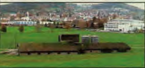
Schweinefabrik in Wallenwil, Kanton Thurgau