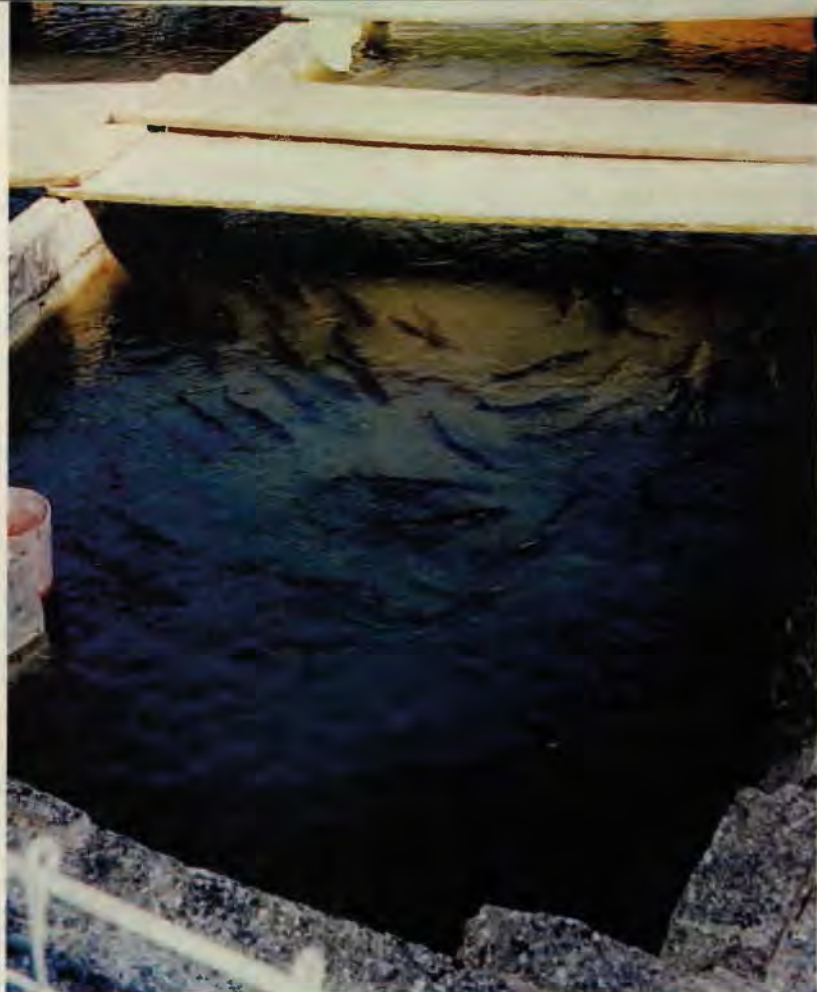
Aufzuchtteich Lochmüli: Stereotypes Schwimmen im Kreis - Verhaltensstörung infolge der Intensivhaltung.