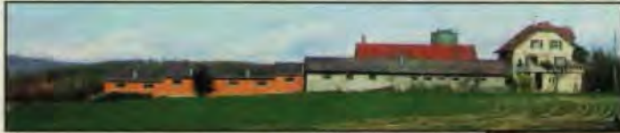
Käserei Scherrer in Trungen bei Bronschofen/SG