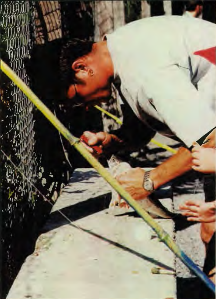
Der noch lebenden Forelle wird der Angel mit dem Taschenmesser herausoperiert. - Man beachte rechts im Bild die Kinderhände. Tierquälerei als Familienvergnügen der besonderen Art.