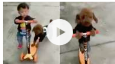
Bub das Kickboard stibitzt So ein Hund!