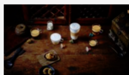
Entdecken Sie Nespresso Master Origin Entdecken Sie Nespresso Master Origin unsere neue Linie Vom Land inspiriert, von Hand geschaffen