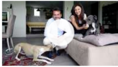
Tierschützer helfen Tessiner nehmen gequälte Hunde auf