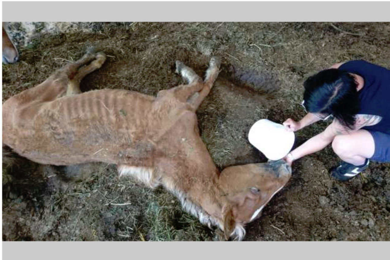
1 / 19 Das Handwerk legten ihm diese Bilder, die eine ehemalige Vertraute heimlich auf seinem Betrieb machte.