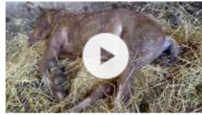
Ein Jahr ist vergangen Quälhof-Drama von Hefenhofen TG