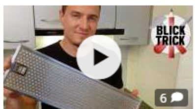
BLICK-Trick So einfach reinigt man den Dampfzug!