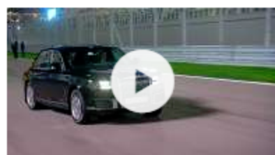
Spritztour mit ägyptischem Präsidenten Putin brettert in Staatskarosse über Formel-1-Strecke