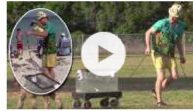
Amerikaner geht mit seinem Fisch Gassi Tierquäler-Youtuber löst Shitstorm aus