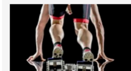
Innovativ und stark am Markt So nützen Schweizer KMU die Digitalisierung für sich.