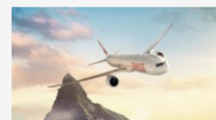
FROM: UNI-HÖRSAAL, TO: WEITE WELT. CHECK. Hast du das Zeug zum Piloten? Finde es heraus – mit nur einem Klick!