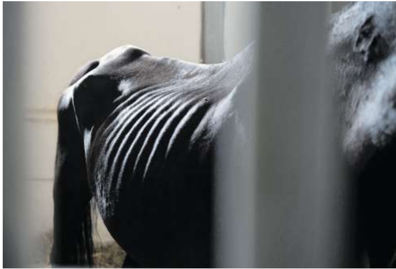
Eines der Pferde von Hefenhofen kurz vor der Versteigerung in Schönbühl.