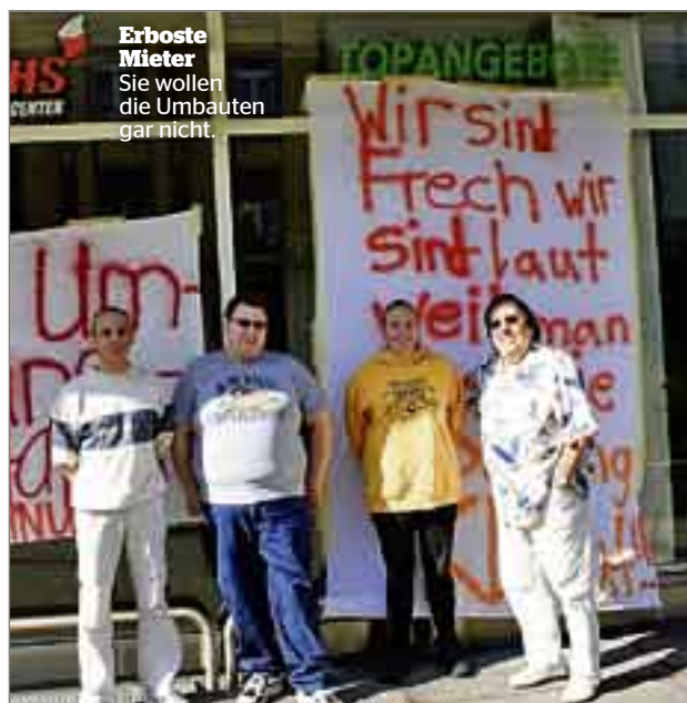
Erboste Mieter Sie wollen die Umbauten gar nicht.

Während des Umbaus müssen die Mieter im Keller duschen und kochen. «Das ist natürlich nie toll. Die Betroffenen erhalten aber eine Mietzinsreduktion.» Die Angst vor steigenden Mieten kann Schwerzmann indes niemandem nehmen. «Nach dem Umbau wird es verhältnismässige Mietzinsanpassungen geben.» ps