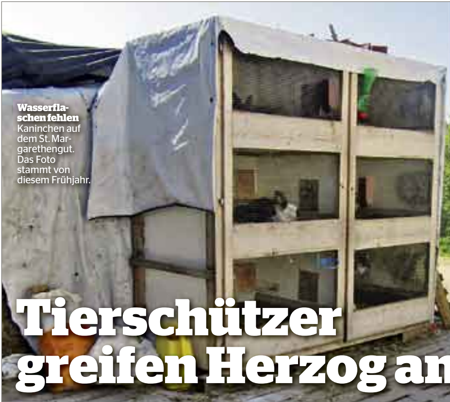
Wasserflaschen fehlen Kaninchen auf dem St. Margarethengut. Das Foto stammt von diesem Frühjahr.