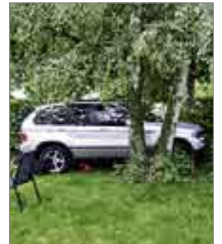
Ungebetener Gast Ein Autofahrer parkierte sein Auto in einem fremden Garten.

UNFALL → Eingeladen war dieser Autofahrer nicht. Trotzdem parkierte er sein Fahrzeug gestern im Garten eines Privathauses in Muttens. Natürlich unfreiwillig. Der 47-jährige Schweizer verlor beim Abbiegen von der Reinacherstrasse in der Unterwartweg aufgrund gesundheitlicher Schwierigkeiten die Kontrolle über sein Auto. In der Folge fuhr er über die Einmündung und kollidierte mit dem Gartenzäun der Liegenschaft. Das Fahrzeug durchbrach diesen und kam schliesslich im Garten zum Stehen, direkt neben einem Baum und unweit eines Gartenstuhls. Der Lenker musste zur Kontrolle ins Spital. Sein Fahrzeug wurde abgeschleppt. Drittpersonen wurden bei dem Unfall keine verletzt. ps