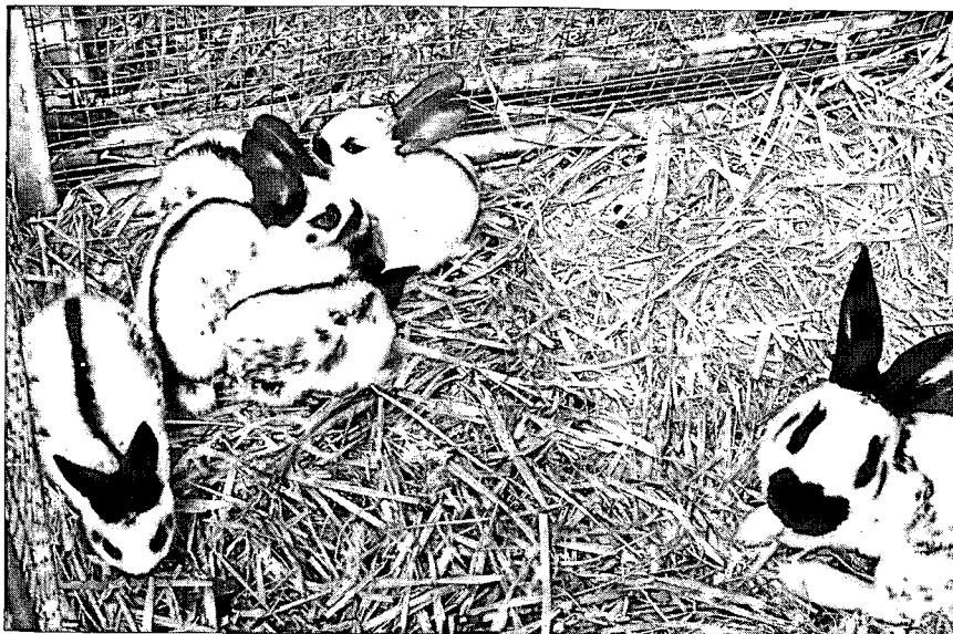
Stehen vor allem bei Kindern hoch im Kurs: Kaninchen, speziell der Nachwuchs

Die Festwirtschaft wurde rege genutzt, sie war überdacht und Regentropfen konnten den Besuchern nichts anhaben.