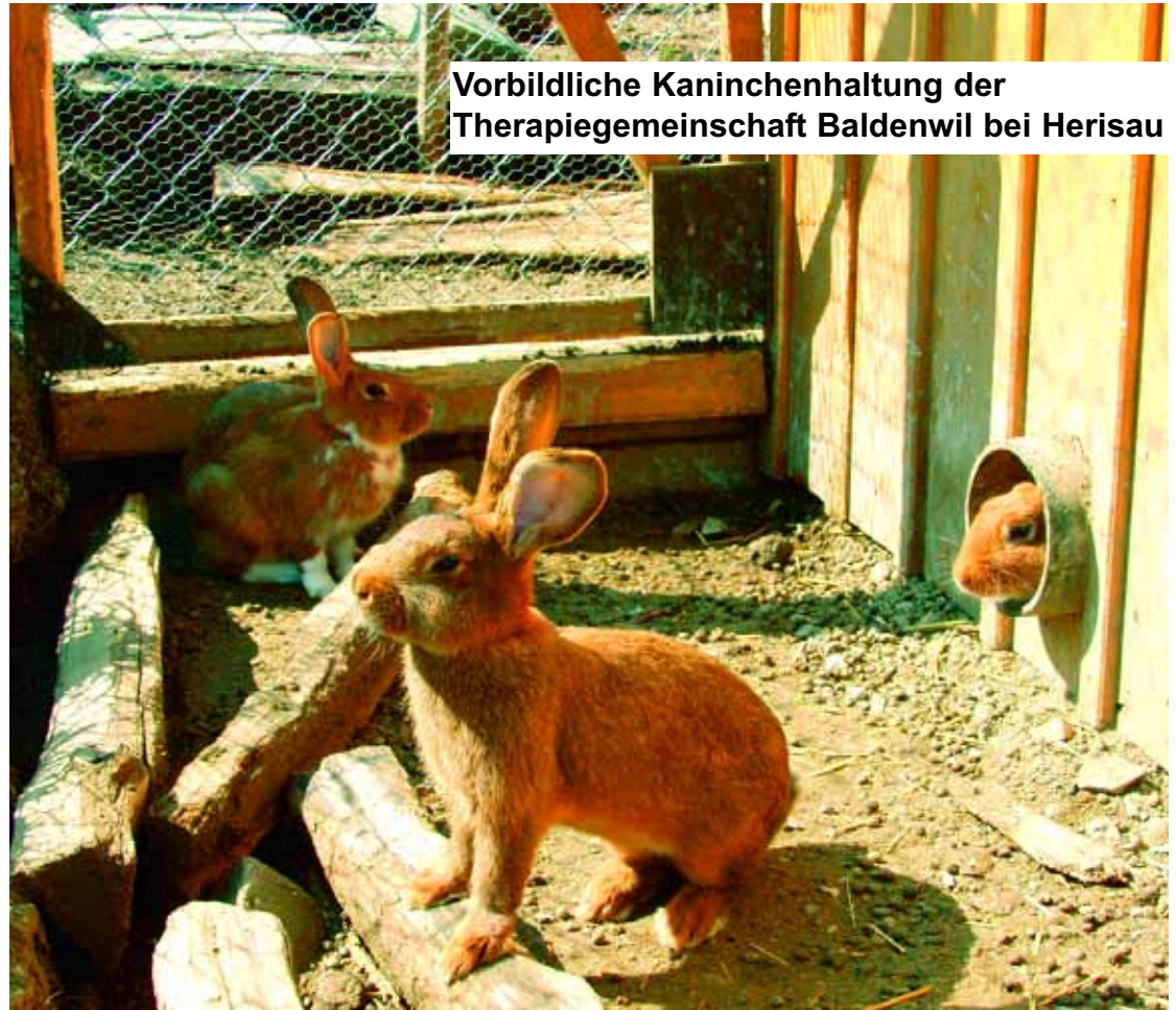
Vorbildliche Kaninchenhaltung der Therapigemeinschaft Baldenwil bei Herisau