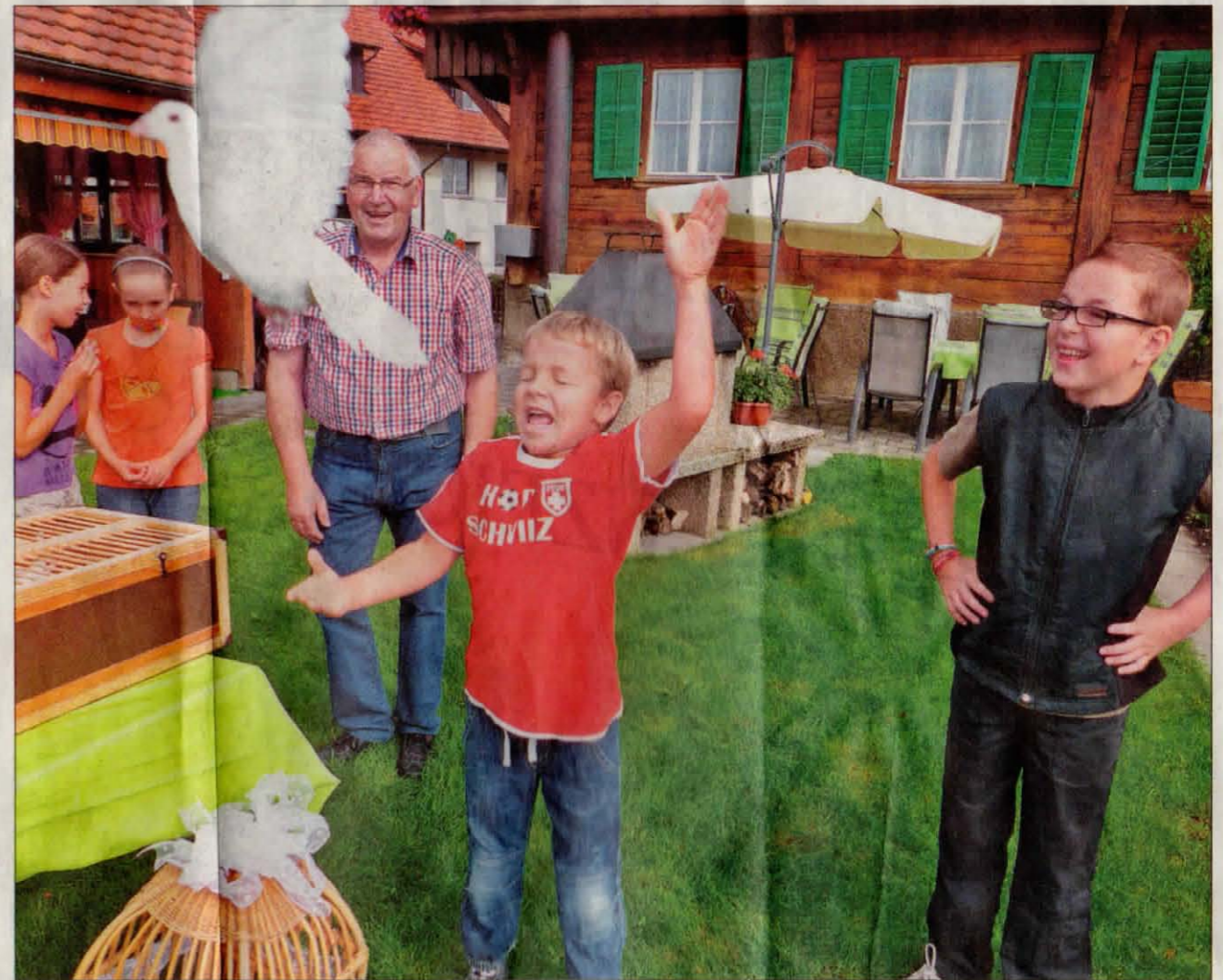
Wie hoch und weit meine Taube wohl fliegen mag?

«Braucht eine Taube besonders lang, dann gibt es an diesem Tag zur Strafe nur etwas Wasser», erklärte er weiter. Ansonsten bekämen die Tau-